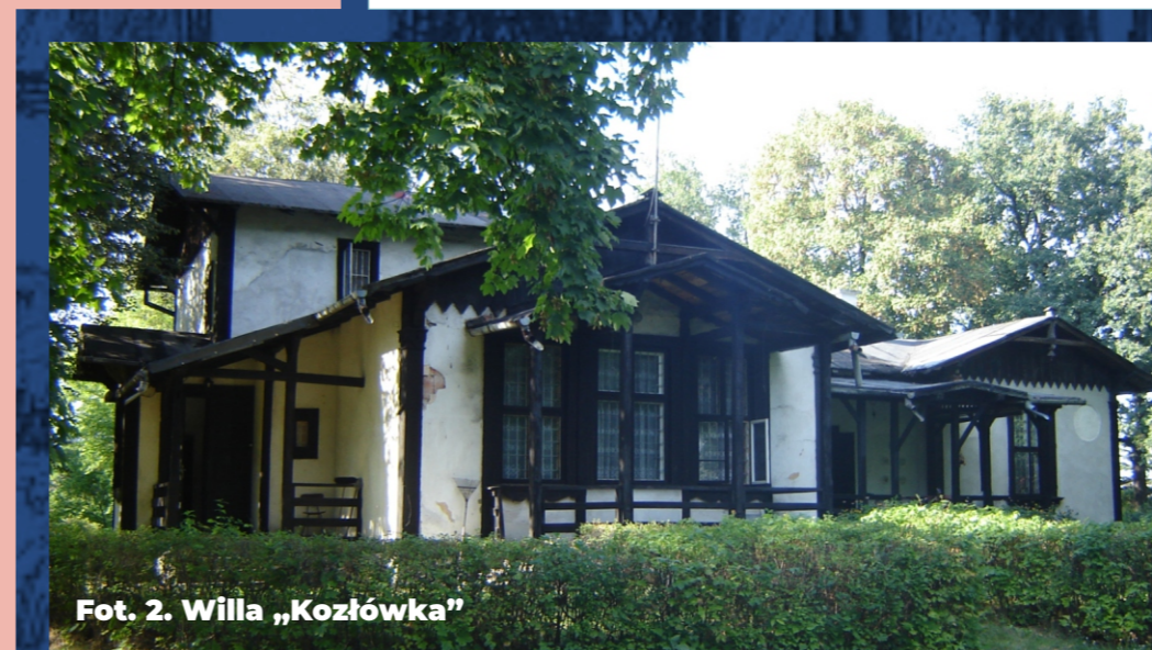
Fot. 2. Willa „Kozłówka”