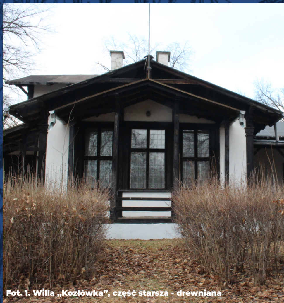
Fot. 1. Willa „Kozłówka”, część starsza - drewniana

ZAPRASZAMY DO OBEJRZENIA FILMU! https://youtu.be/BA6PvSXv230